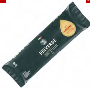
LINGUINE 24 X 0,5KG BRONZO DELVERDE