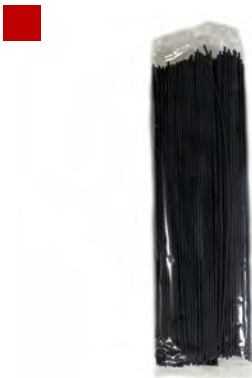
SPAGHETTI NERO DI SEPPIA 0,5KG 12U MORELLI