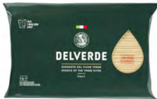
SPAGHETTINI 3KG X 4UD DELVERDE