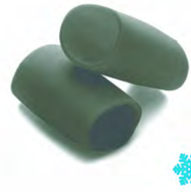
PACCHERI AL NERO DI SEPPIA 2KG X 1UD CANUTI