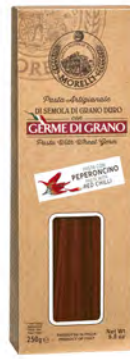
LINGUINE PEPERONCINO C/AST 0,25KG 16U