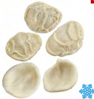
ORECCHIETTE 3 KG X 1UD GRANBOLOGNA