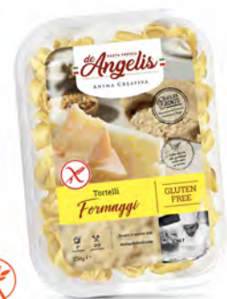
TORTELLONI FORMAGGI SIN GLUTEN 250GX8U DEANGELIS