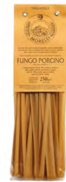
TAGLIATELLE FUNGHI PORCINI 0,25KG 8U MORELLI