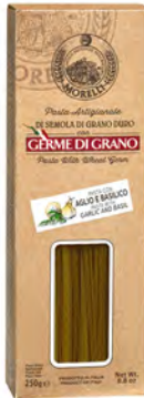
LINGUINE AGLIO/BASIL C/ASTU 0,25 KG X 16