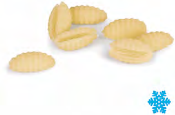
GNOCCHETTI SARDI 3KGX1U NEGRINI