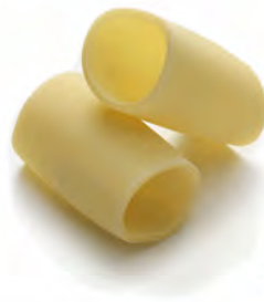
PACCHERI 2KG X1UD CANUTI