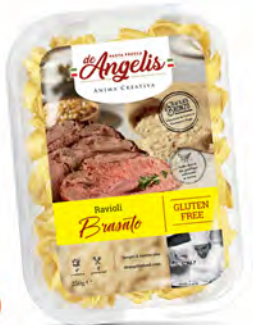
RAVIOLO BRASATO SIN GLUTEN 250X8U DE ANGELIS