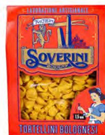
TORTELLINI BOLOGNESI 250GX10U SOVERINI