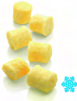
GNOCCHI CASERECCI PATATE E UOVA 1KG X 5UD CANUTI