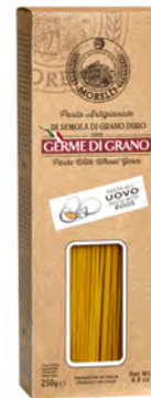
TAJARIN TARTUFO NERO 250GRX6UD