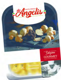
MEDAGLIONI AI FUNGHI E TARTUFO 250GX8U DE ANGELIS