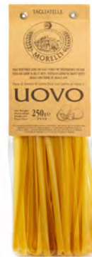
TAGLIATELLE ALL'UOVO 250G 8U MORELLI