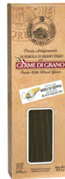
LINGUINE NERO DI SEP C/ASTU 0,25KG 16U M