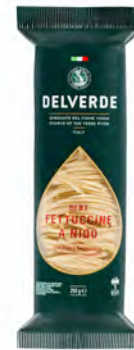
FETTUCCINE NIDO SEMOLA 12UDX0,25KG DELVERDE