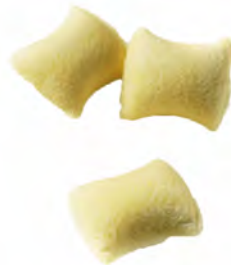
GNOCCHI AI FORMAGGI 1KG x 5UD CANUTI