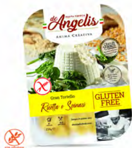
TORTELLI RIC/SPIN. SIN GLUTEN 250GX8U DE ANGELIS