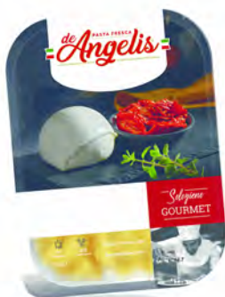
TORTELLONI BUFALA/POMOD.SECCHI 250X8U DE ANGELIS