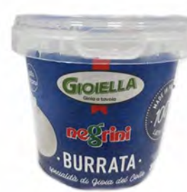
BURRATA 200GR IN SECCHIELLO X 8 UNID