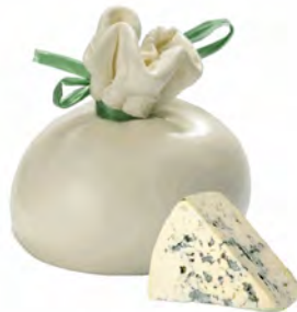
BURRATA AL GORGONZOLA 250GR X4