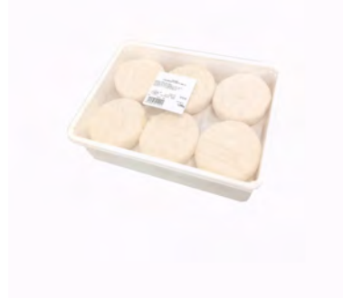
TOMINI 90GX12pz ARRIGONI