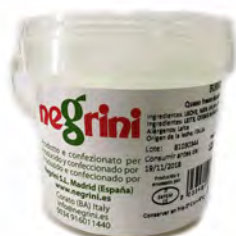
BURRATINA SECCHIELLO 125GX6UD NEGRINI