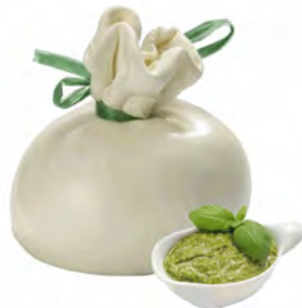
BURRATA AL PESTO 250GR X4UD NEGRINI