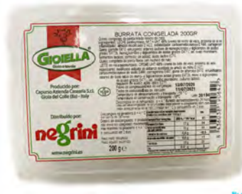
BURRATA 200GR CONGELADA X 8UDS NEGRINI