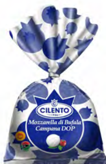
MOZZARELLA BUFALA DOP CLIP(busta)250GX8UD CILENTO