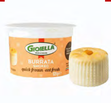
BURRATA AFFUMICATA CONGELATA 125GX6UD GIOIELLA