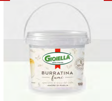
BURRATINA AFFUMICATA 100GRX8UDS GIOIELLA