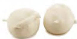
BURRATINA 125GRX8UND X 2 BANDEJAS