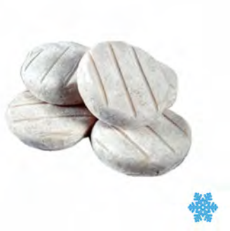
TOMINI CONGELATI 1KG (0,09X11U) X 6UDS CEPPARO