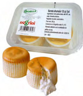
BURRATA AFFUMICATA 125GR X 2 (8 BANDEJITAS)