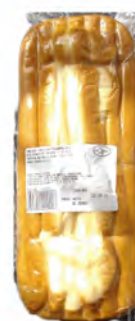
SCAMORZA (PROVOLA) IN BARRA 1KG X 6UDS