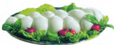
MOZZARELLA BUFALA TRECCIA 2KGX1UD CILENTO