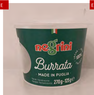
BURRATINA SECCHIELLO MAS CAD. NEGRINI 125GR X 8