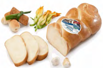
TRECCIONE(PROVOLA)AHUMADO 3KG aprox ZAPPALÁ 2UN/CJ