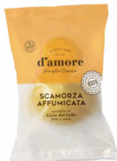
SCAMORZA AFFUMICATA 300GX8U D'AMORE