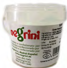
BURRATA 150G X 8UD MAS CADUCIDAD NEGRINI