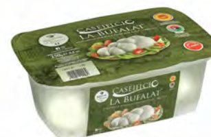
MOZZARELLA DI BUFALA DOP TRECCIA 250GX8UD BUFALAT