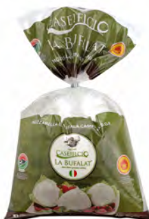
MOZZARELLA DI BUFALA CAMPANA DOP 500GX3UD BUFALAT