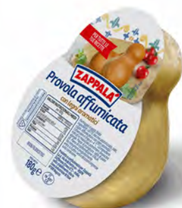
CACETTI AFFUMICATI 180GX10UD LAT. SICILIANE