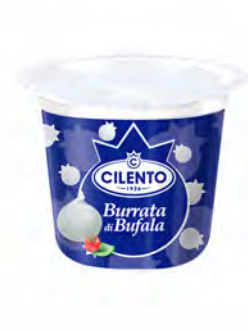
BURRATA DI BUFALA 200 GRx6UD CILENTO