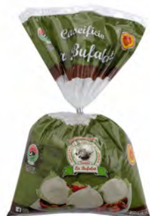
MOZZARELLA DI BUFALA CAMPANA DOP 250GX6UD BUFALAT