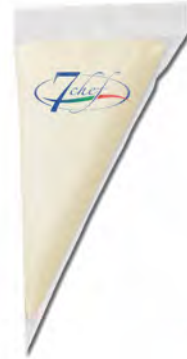
CREMA PARMIG. REGGIANO EN MANGA 500G X 8UD GUERRA