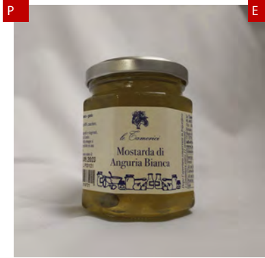
MOSTARDA DI ANGIURIA BIANCA 220G X 6UD TAMERICI