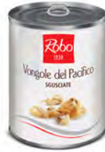
VONGOLE SGUSCIATE NAT 800GR X 6 UD ROBO