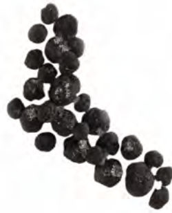
TARTUFO TUBER AESTIVUM CONGELADO 500GX10 UDS APPEN