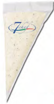
CREMA GORGONZOLA EN MANGA 500G X 8UD GUERRA