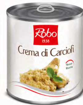
CREMA CARCIOFI 800 GR X 6 UDS ROBO