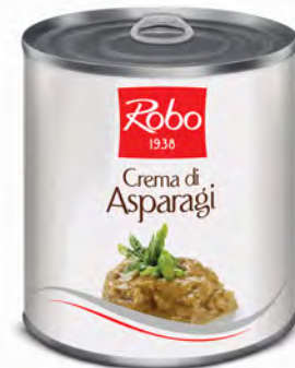
CREMA DI ASPARAGI 800 GR X 6 U ROBO