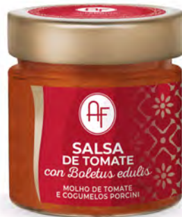
SUGO AL POMODORO/FUNGI PORCINI 200GX6UD APPENNINO