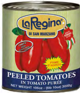
PELATI REGINA SAN MARZANO 3 KG X 6UD