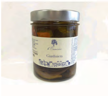
GIARDINIERA 400G X 6UD LE TAMERICI