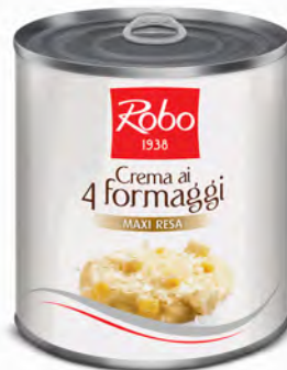
CREMA 4 FORMAGGI 800 GR X 6 UD ROBO