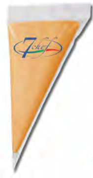
CREMA CHEDDAR EN MANGA 500GX8U GUERRA