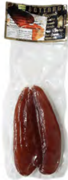
BOTTARGA DI MUGGINE 80/110G 2U/CAJA THARROS PESCA