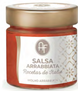
SALSA ARRABBIATA 200GX6UD APPENNINO