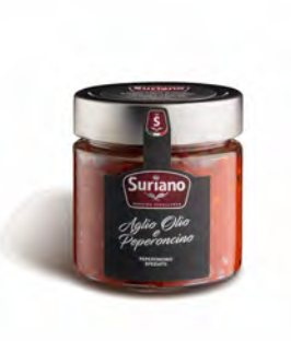
CREMA AGLIO OLIO E PEPERONCINO 200GR X 12U SURIANO