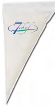
CREMA MOZZARELLA BUFALA EN MANGA 500G X 8UD GUERRA