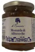
MOSTARDA DI ALBICOCCA 220G X 6UD TAMERICI