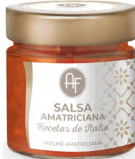
SALSA AMATRICIANA 200GX6UD APPENNINO