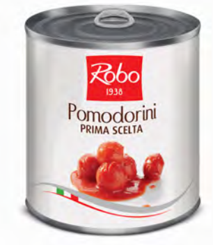
POMODORINI DI COLLINA PRIMA SCELTA 800GRX6UD