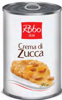
CREMA DI ZUCCA 400G 6U ROBO