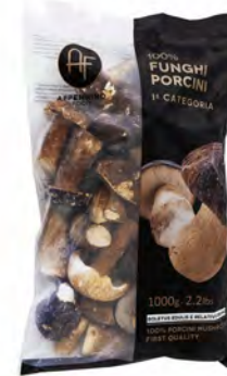
FUNGHI PORCINI CONG COMM INTERI 1KG 5U APPENNINO