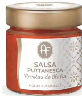
SALSA PUTTANESCA 200GX6UD APPENNINO