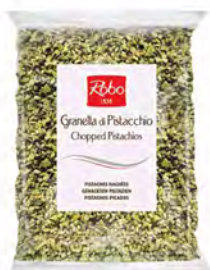
GRANELLA DI PISTACCHIO BUSTA 500GX3UD ROBO