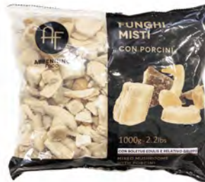
FUNGHI PORCINI CONG MISTI 1 KG X 6 APPENNINO