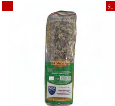
ORIGANO A MAZZO 40GRX25UD