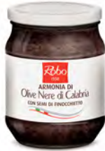
ARMONIA OLIVE NERE 530G 6U ROBO