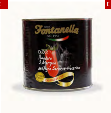
POMODORO SAN MARZANO DOP 2,50 KG X 6U FONTANELLA