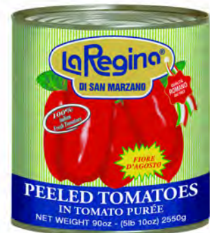
PELATI REGINA SAN MARZANO 2,55 KG X 6UD