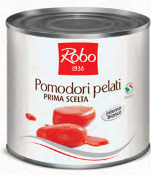
POMODORI PELATI 2,5 KG X 6UD ROBO