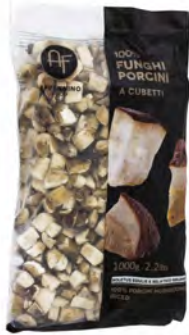
FUNGHI PORC CONG CUBETTI 1 KG X 6 APPENNINO