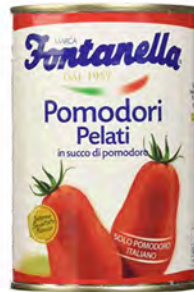
POMODORI PELATI 2,50 KG X 6U FONTANELLA