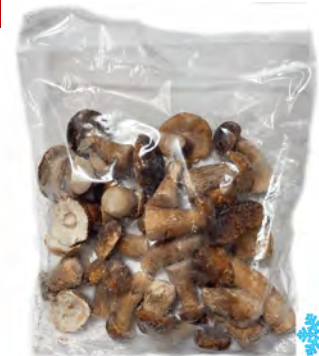
FUNGHI PORCINI CONG INTERI PRIMA 1KG 5U NEGRINI