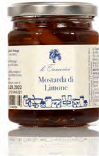
MOSTARDA DI LIMONE 220GR X 6 LE TAMERICI