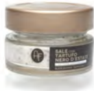
SALE AL TARTUFO NERO 50GX6 UDS AF