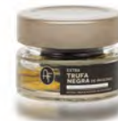
PERLAGE 200 GR X 4 UDS TARTUFLANGHE