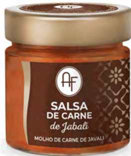
SALSA RAGÚ JABALÍ 200GX6UDS APPENNINO