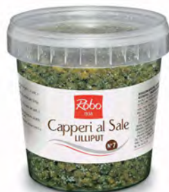
CAPPERI AL SALE N°7 LILLIPUT 1KGX6UD ROBO